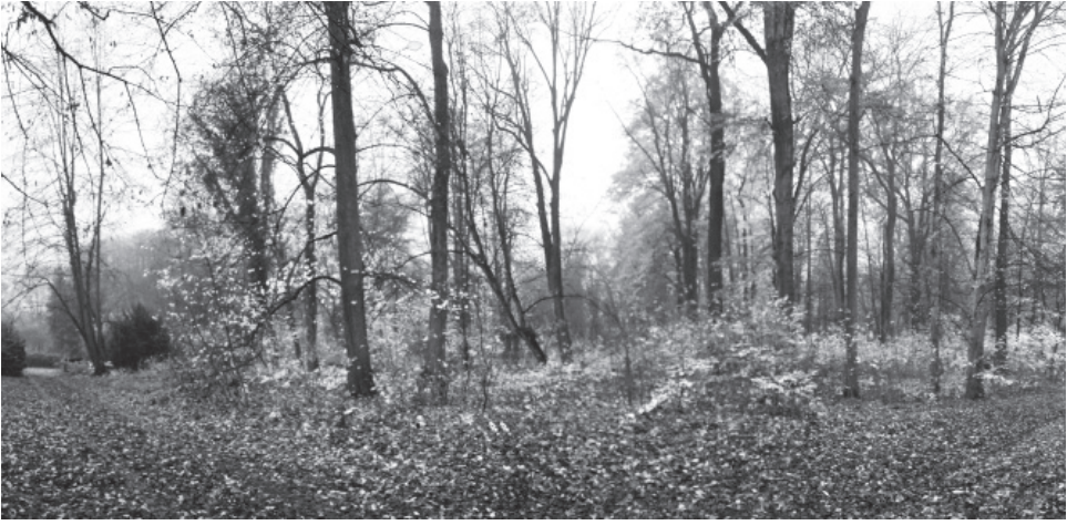
2 | Zu Beginn der Arbeiten ist der Blick aus Richtung Norden zur Feuchtwiese noch durch Aufwuchs verschlossen, Fotografie, Nora Kindermann 2014 (privat).