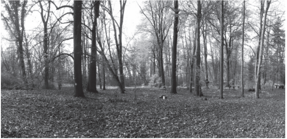
4 | Nach der Entfernung des dichten Auswuchses ist der Blick zur Feuchtwiese wieder weitgehend geöffnet, Fotografie, Nora Kindermann 2014 (privat).