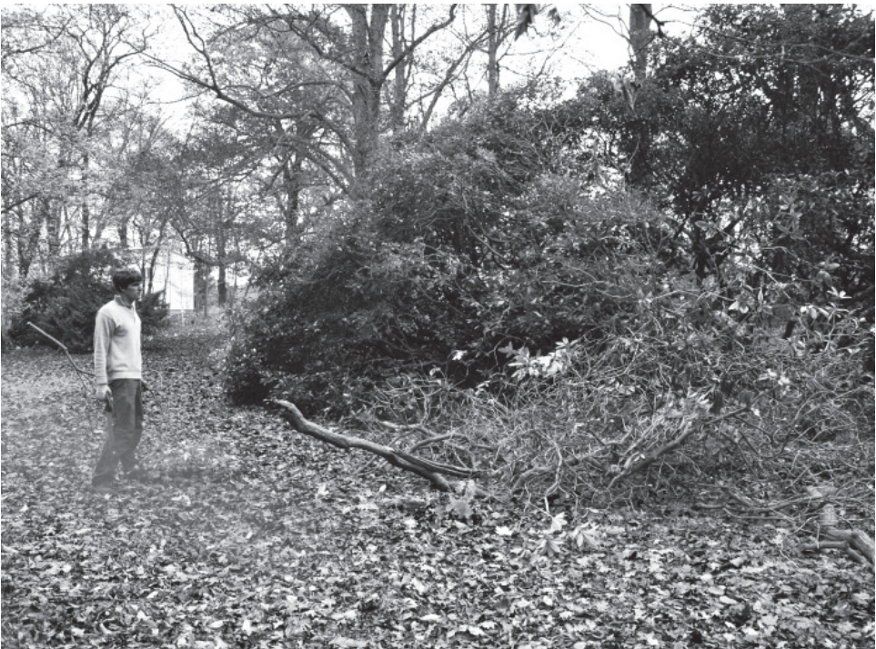
7 | Fachgerechter Rückschnitt der großen Rhododendrengruppe im Bereich der Gedenkstätte, Fotografie, Jenny Pfriem 2016 (privat).