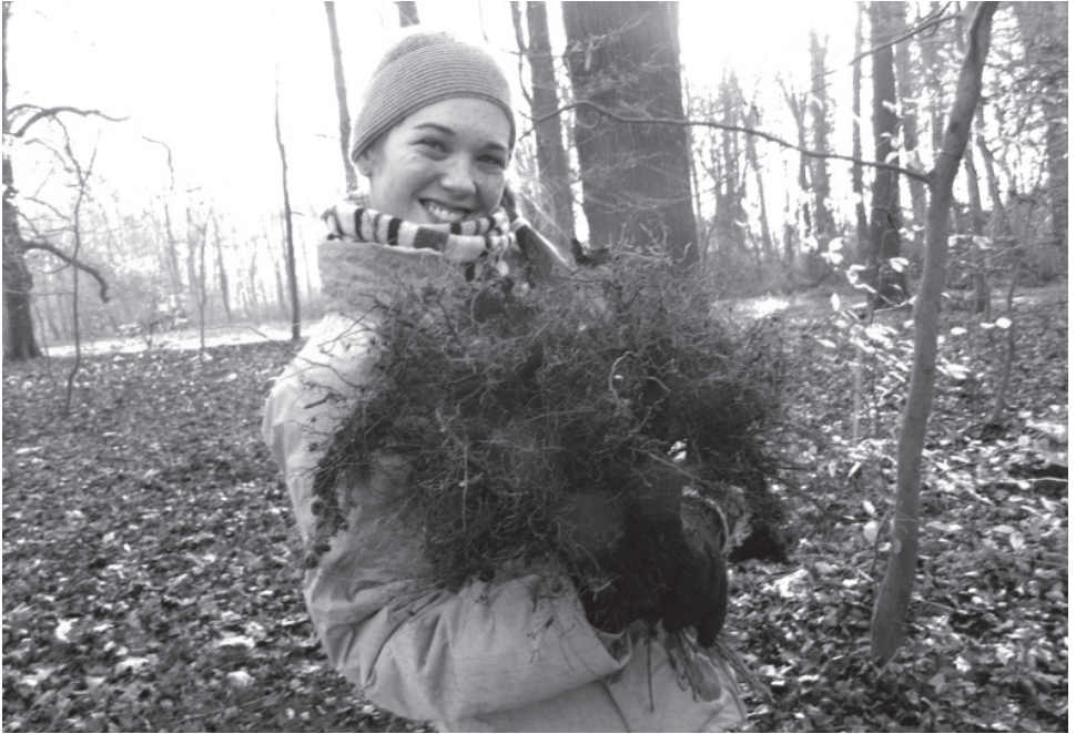
8 | Sämlingsstrauß aus über 100 Stück Spitz-Ahorn, Fotografie, Nora Kindermann 2014 (privat).