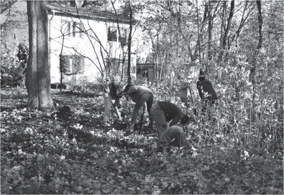
6 | Studierende bei der Entfernung von Sämlingen im Bereich der Gästehäuser, Fotografie, Jenny Pfriem 2016 (privat).