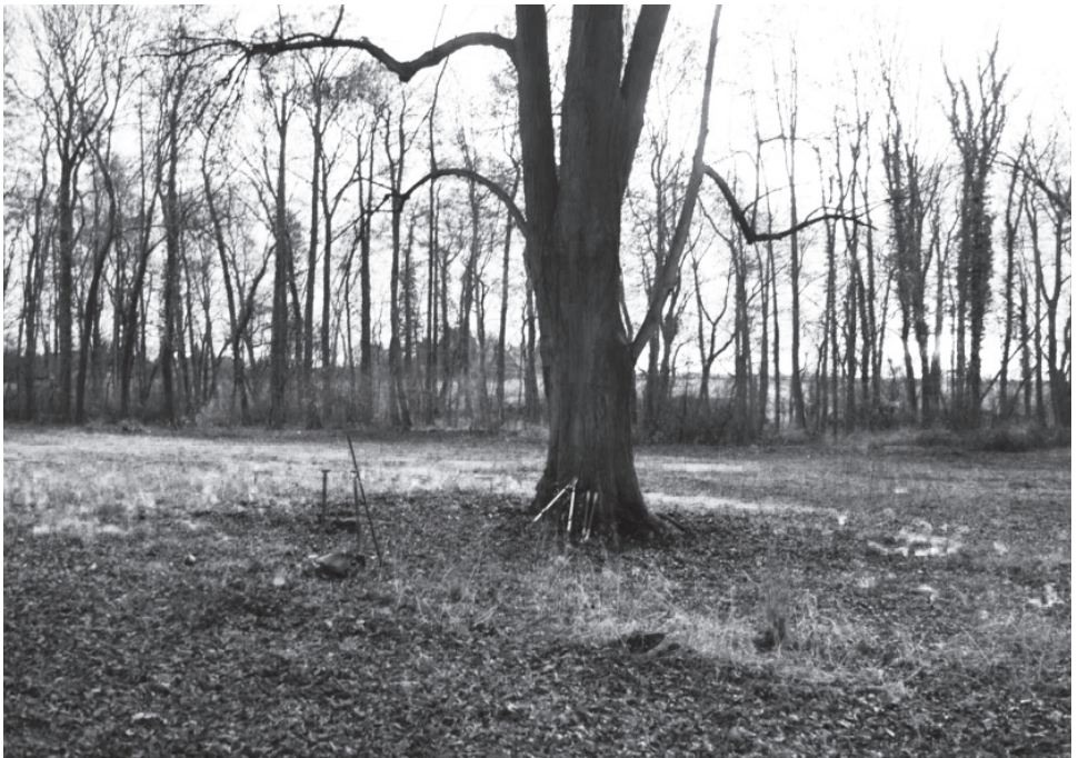
5 | Nach der Beseitigung der Stockastriebe ist die Mähbarkeit der Wiese an dieser Stelle wieder hergestellt, Fotografie, Nora Kindermann 2015 (privat).