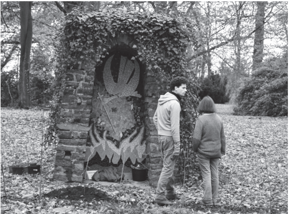
9 | Herstellung einer Zuwegung zur Grotte und Vorbereitung der Pflanzarbeiten, Fotografie, Jenny Pfriem 2016 (privat).