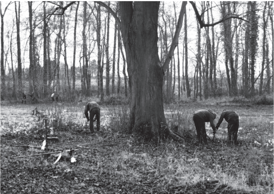
3 | Studierende entfernen Stockaustriebe an einer Linde im Bereich der Feuchtwiese, Fotografie, Nora Kindermann 2015 (privat).