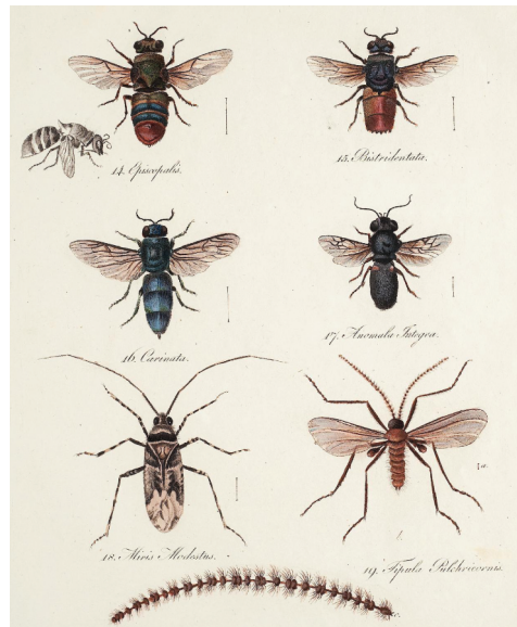
7 | Illustrationen zu den Artbeschreibungen in Peter Ludwig Heinrich von Blocks entomologischem Beitrag. Radierung/Kupferstich, koloriert, Mühlberg (Vorname unbekannt), vor 1799 (aus: Becker 1799, 2. eingebundener Teil, Digitalisat bereitgestellt von der Universitätsbibliothek Heidelberg, Public Domain Mark 1.0).

Andreas Tauber, der für die »Mineralogische[n] Beschreibungen des Plauischen Grundes bis Tharand« im Werk verantwortlich zeichnete, ist heute weitgehend unbekannt – es ist zu hoffen, dass im Rahmen des Projekts seine Biografie verdichtet werden kann. Die zu Taubers Beitrag gehörenden Kupferstiche (Höhenprofile und geologische Querschnitte; Abb. 8–9) deuten darauf hin, dass er den innovativen Ansatz der seit 1788 betriebenen systematischen geologischen