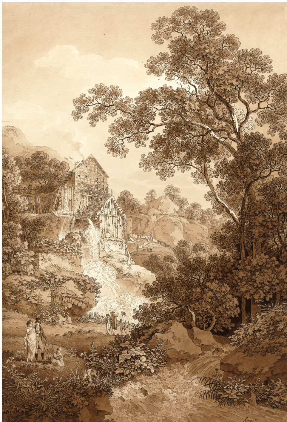
16 | Die Keppmühle bei Dresden-Hosterwitz. Der das Mühlrad antreibende Wasserlauf stürzt die Felsenklippe herab, wird als Wasserfall uminterpretiert und in die Ästhetik eingebunden. Umrissradierung, braun laviert, aus der Werkstatt Adrian Zinggs, zweite Hälfte 18. / frühes 19. Jahrhundert (Kupferstich-Kabinett, Staatliche Kunstsammlungen Dresden, Inv.-Nr. A 1906-157).