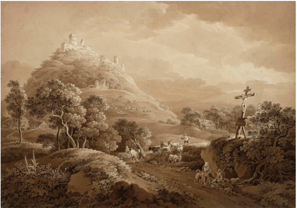
6 | Die Hasenburg in Böhmen. Die Ruine der gotischen Burg (»Hazmburk«) bei Libochovice ist noch heute eine weithin sichtbare Landmarke im böhmischen Mittelgebirge. Feder in Schwarz, Pinsel in Braun, Deckweiß, Adrian Zingg, zweite Hälfte 18. / frühes 19. Jahrhundert (Kupferstich-Kabinett, Staatliche Kunstsammlungen Dresden, Inv.-Nr. C 4324).

»Aehnlicher Parthien, wie diese [Keppgrund bei Dresden-Pillnitz], giebt es unzählige auf beiden Seiten der Elbe von Meißen bis Schandau, wie der Schonergrund, der Loschwitzer und Ziegengrund, wie die Gründe von Lockwitz und Röhrsdorf, welche letztere durch ihre Besitzer noch durch mancherlei Anlagen verschönert worden. Aber auch größere Naturparthien giebt es genug, die selbst in der Schweiz unter ihren malerischen Gegenden noch immer einen ansehnlichen Rang behaupten würden. Wer denkt nicht sogleich in der Nähe von Dresden des Plauischen Grundes, der alle Fremde bezaubert, und selbst für Einheimische nie von seinen Reizen verliert. Schwerlich wird man ein Thal finden, in dem man so viele Schönheiten der Natur versammelt, und dabei so reizende Abwechslungen findet, wie hier. Der ganze Grund vom Dörfchen Plauen bis Tarant, wo wieder andere Thäler beginnen, eine reizende Strecke von zwei Stunden in der Länge, übertrifft alles, was irgend von englischen Gärten, wenn man ihre Denkmäler der Kunst ausnimmt, der Berühmtheit werth ist.« 12