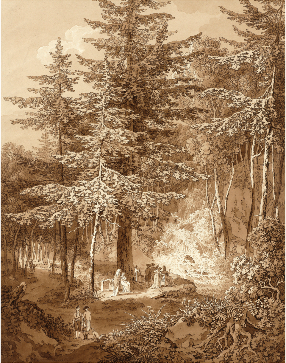
15 | Der Wasserfall im Friedrichsgrund mit fürstlicher Gesellschaft. Der künstliche Wasserfall steht hier exemplarisch für eine Maßnahme, die dem erhabenen Charakter und der naturgegebenen topografischen Situation der Partie angemessen ist. Umrissradierung, braun laviert, Adrian Zingg, zweite Hälfte 18. / frühes 19. Jahrhundert (Kupferstich-Kabinett, Staatliche Kunstsammlungen Dresden, Inv.-Nr. A 1906-158).

beziehungsweise -wahrhaftigkeit immanent ist als einem Garten, der Natur nachbildet: »Der Naturkünstler hingegen muss sich fast niemals Täuschung erlauben: er biete der Wahrheit der Natur wieder Wahrheit dar! Sein Zweck ist nicht, in einem bestimmten Bezirke eine schöne Natur im Kleinen zu schaffen; er unternimmt die Natur zu verschönern, zu veredeln und noch mehr zu beleben.« 62