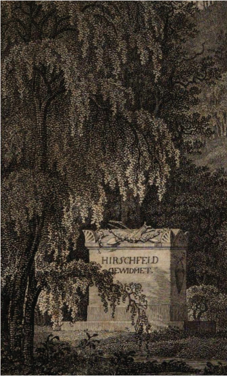
11 | Frontispiz von Beckers »Taschenbuch für Gartenfreunde von 1795« mit dem Denkmal »Hirschfeld gewidmet« – als deutlich sichtbarer Hinweis auf Beckers Bezugnahme auf Hirschfeld. Kupferstich, Johann Adolph Darnstedt (nach einer Zeichnung von Johann Gottfried Klinsky), 1793 (aus: Becker 1794, Titelblatt).

Vorwelt und — Nachwelt (möcht' ich sagen) geduldig beisammen erblickt; wo künstliche Hügel und künstliche Thäler, wie Meereswogen, aufeinander folgen, und Graben gezogen werden, um Brücken drüber zu bauen; und wo nicht nur die Anlagen eine große, nie zu berechnende Summe in sich hineinziehen, sondern wo überdieß noch die jährlichen Unterhaltungskosten den ganzen Ertrag eines bedeutenden Ritterguths brauchen. Hier aber in dieser verschönerten Landschaft, wo das Geschmückte vielmehr vermieden, als gesucht werden dürfte, würden die erforderlichen Unterhaltungskosten, in Vergleichung mit jenen, von keinem großen Belang seyn.« 19