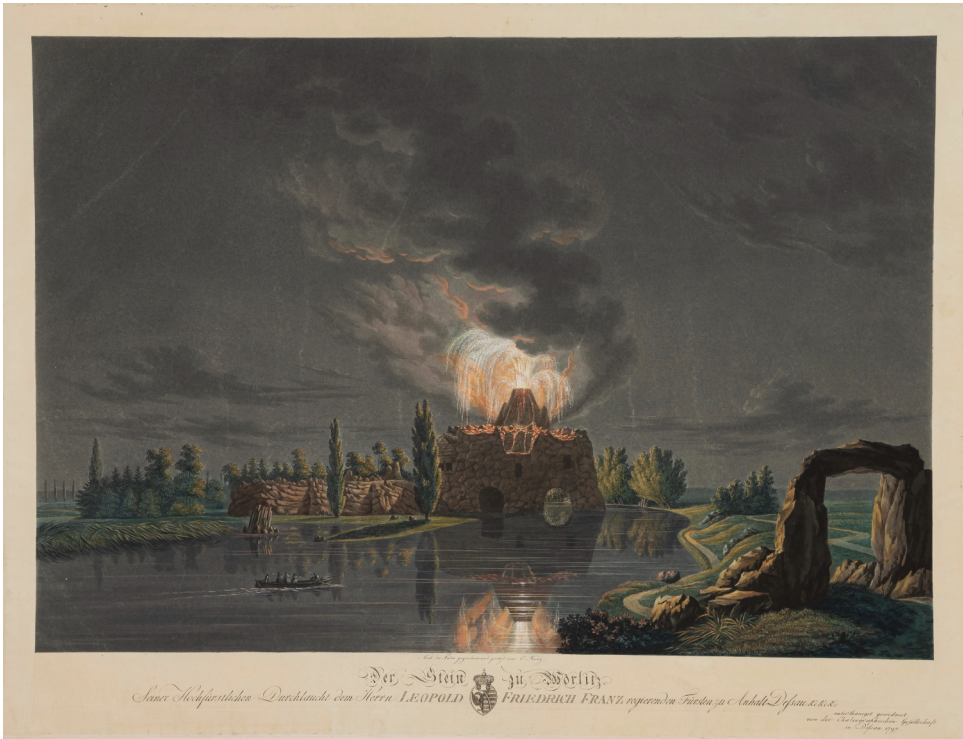
12 | »Der Stein zu Wörlitz« (Inscription: »Seiner Hochfürstlichen Durchlaucht dem Herrn LEOPOLD FRIEDRICH FRANZ regierenden Fürsten zu Anhalt-Dessau [...] unterthänigst gewidmet von der Chalkographischen Gesellschaft in Dessau 1797«). Der dem Vesuv nachempfundene künstliche Vulkan wurde bei festlichen Anlässen zum »Ausbruch« gebracht. Aquatinta, koloriert, Carl Cuntz, 1797 (Kulturstiftung Dessau-Wörlitz, Bildarchiv, Inv.-Nr. IV-371, Fotografie: Heinz Fräßdorf).

Im Buch werden weitere Merkmale einer verschönerten Landschaft herausgestellt, die sie von einer »freien Gartenanlage« unterscheiden: