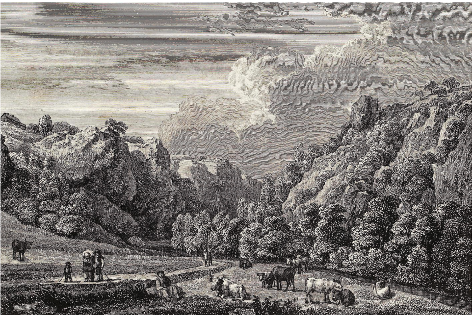
14 | »Gegend zwischen Pöschel und der Pulvermühle auf dem Rückwege«. Radierung/Kupferstich, Johann Adolph Darnstedt (nach Johann Christian Klengel), vor 1799 (aus: Becker 1799, 1. eingebundener Teil).