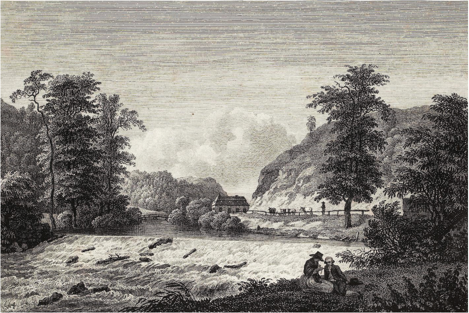
13 | »Das Wehr hinter der Buschmühle«. Radierung/Kupferstich, Johann Adolph Darnstedt (nach Johann Christian Klengel), vor 1799 (aus: Becker 1799, 1. eingebundener Teil, Digitalisat bereitgestellt von der Universitätsbibliothek Heidelberg, Public Domain Mark 1.0).