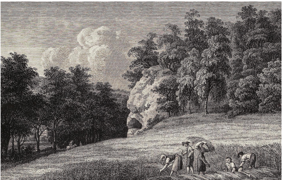
17 | »Das Riesenbette«. Eine Landmarke im Plauenschen Grund ist bis heute der »Backofenfelsen« mit der großen Höhle, die der Sage nach ein Riesenbett gewesen sein soll. Im Vordergrund ist die ländliche Bevölkerung bei Erntearbeiten zu sehen. Radierung, Johann Adolph Darnstedt (nach Johann Christian Klengel), vor 1799 (aus: Becker 1799, 1. eingebundener Teil, Digitalisat bereitgestellt von der Universitätsbibliothek Heidelberg, Public Domain Mark 1.0).

Ohne dies in diesem Rahmen erschöpfend darstellen zu können, sei immerhin angemerkt, dass er damit unter anderem an Rousseaus Gedanken zur Natur und Schillers Betrachtung »Über die ästhetische Erziehung des Menschen« (1795) anknüpfte.