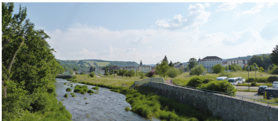
3 | Im Bereich Freital öffnet sich das »Döhlener Becken«, ein kreidezeitliches Sedimentbecken, das einst reich an Bodenschätzen war.