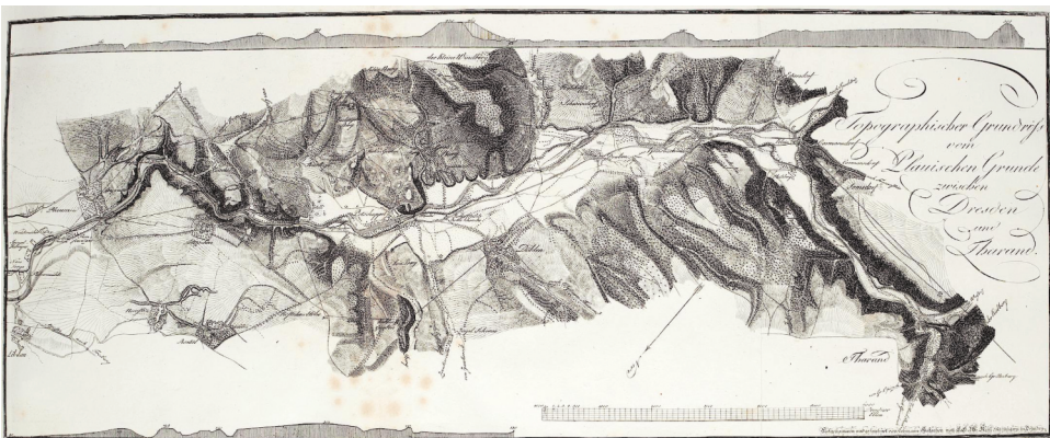
10 | »Topographischer Grundriss von Plauschen Grunde zwischen Dresden und Tharandt«. Radierung/Kupferstich, Christian Maximilian Keyl (nach Johann Georg Lehmann), vor 1799 (aus: Becker 1799, 1. eingebundener Teil, Digitalisat bereitgestellt von der Universitätsbibliothek Heidelberg, Public Domain Mark 1.0).

»Auch vergnügt sich der wahre Freund der Natur nicht bloß an ihrem äußeren Gewande: er dringt, so viel er vermag, in alles was sie merkwürdig macht; beschäftigt sich mit den Producten, die sie erzeugt und ernährt, und betrachtet den Fleiß der Menschen, welche diesselben zu ihrem Nutzen verwenden, mit Wohlgefallen. Mit neuem Vergnügen kehrt er dann zum Anschauen ihrer Reize zurück: er weiß sie nun noch höher zu würdigen. Seine Empfindungen sind itzt mit Betrachtungen durchwebt, denn sein Geist schwebt über dem Ganzen.« 16