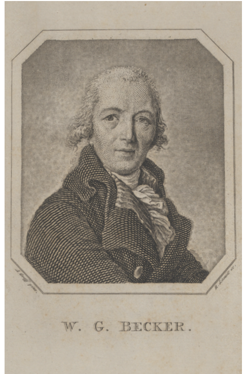
1 | Brustbildnis von Wilhelm Gottlieb Becker. Kupferstich/Radierung, Heinrich Friedrich Thomas Schmidt (nach Anton Graff), vermutlich um 1800 (LWL-Museum für Kunst und Kultur, Westfälisches Landesmuseum, Münster / Porträtarchiv Diepenbroick, Inv.-Nr. C-509229 PAD).

Aus dem wissenschaftlichen Anspruch nährt sich auch die interdisziplinäre Leistung, die mit dem Buch vollbracht wird – und die vielleicht die augenscheinlichste Manifestation der Neuartigkeit der Beckerschen Ideen ist: Um den Landschaftsraum holistisch zu fassen, engagiert Becker mehrere Wissenschaftler – teils Koryphäen ihres Fachs –, Beiträge zu dem Werk abzufassen und webt selbst, gleichsam mit diesen Stimmen interagierend, Gedanken zu Geologie, Geomorphologie, Klima, Agrarwirtschaft usw. in seine ästhetische Konzeption ein. 1