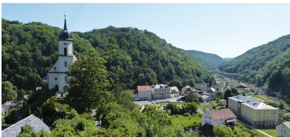
4 | Blick von der Burgruine Tharandt nach Osten. Nach der Entdeckung zweier Mineralheilquellen (1792/94) wurden die bewaldeten Hänge Tharandts sukzessive mit Spazierwegen erschlossen.