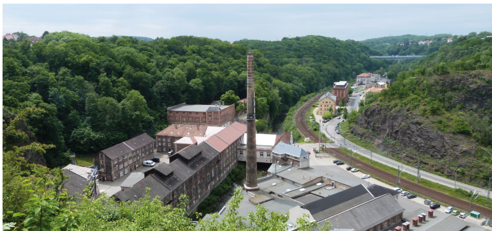
2 | Blick vom Hohen Stein nach Südwesten. Die ehemalige Dresdner Felsenkellerbrauerei (1859–1991), die Bahnstrecke (1855 eröffnet) und die Autobahnbrücke haben den einst »romantischen« Talabschnitt drastisch verändert (Fotografie: Anja Gottschalk, 2021).